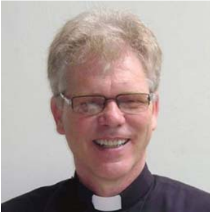
Bischof Reinhold Nann, Caraveli / Peru

siehe Veröffentlichung: basis-online.net