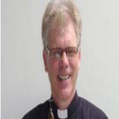
Bischof Reinhold Nann, Peru