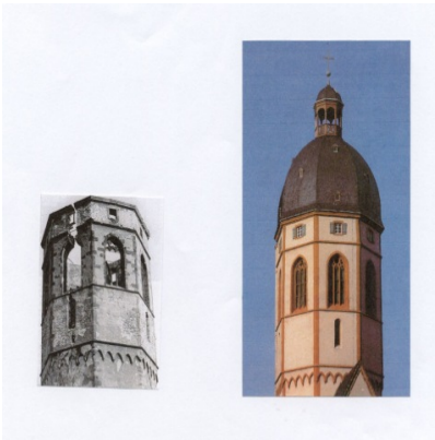
Der Turm von St. Stephan in Mainz